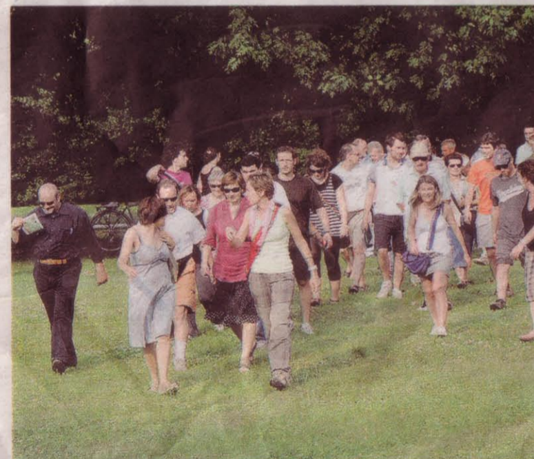
DIVISI IN GRUPPI L'adesione alle manifestazioni in ricordo del dramma della diossina ha superato ogni aspettativa