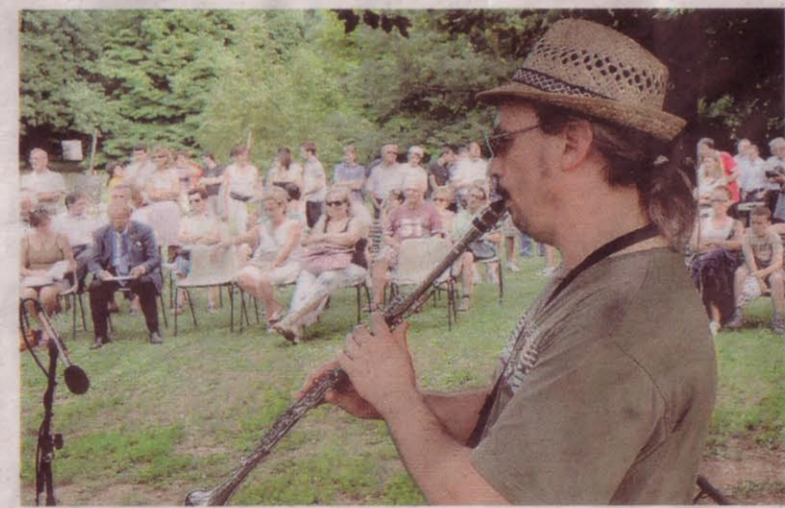
COMMEMORAZIONE Anche oggi sarà possibile visitare le vasche

«IO FACEVO PARTE della squadra speciale di operai che puliva le vasche - racconta un ex operaio sevesino di 59 anni che preferisce non dire il suo nome - Era la fine degli anni '80 e chi lavorava a contatto della diossina prendeva paga doppia. Era molto impressionante. Ci mettevano una tuta bianca e delle maschere bianche che poi bruciavano. Mi ricordo il sapone dall'odore acre che ci davano per la doccia, mentre con delle pompe ci innaffiavano con un liquido disinfestante. L'acqua che noi adoperavamo finiva in due cisterne e poi veniva buttata nel Certosa. Eravamo in tanti, divisi in squadre: abbiamo chiuso il cantiere nell'81. Sono venuto nella speranza di ritrovare altri colleghi che come me hanno lavorato in quegli anni in quest'area senza sapere a cosa andavano incontro.